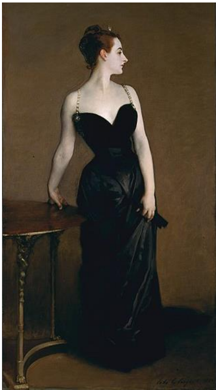
El retrato de Madame X. John Singer Sargent, 1884.

“El retrato de Madame X”, titulado primeramente “El retrato de Madame Pierre Gautreau” es un cuadro elaborado con la técnica del óleo sobre tela, de tamaño 234,95 cm x 109,86 cm, en el año 1884 por John Singer Sargent, reconocido por ser uno de los pintores más exitosos de la época. La pintura retrata a una bella y joven mujer norteamericana de piel pálida azulada que contrasta con su ajustado y escotado vestido negro de satín y piedras preciosas, diseñado exclusivamente para ella. Usa el cabello recogido mostrando su cuello, pecho y espalda y mantiene una postura alzada y distraída, dando una impresión de altanería y vanidad. Esta mujer, llamada Virginie Amélie Avegno Gautreau, fue esposa de un banquero francés muy reconocido que tenía bastantes años más que ella, y como muchas jóvenes bellas casadas con veteranos, tal